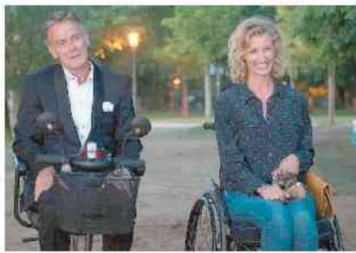
Tutti in piedi, regia di Franck Dubosc