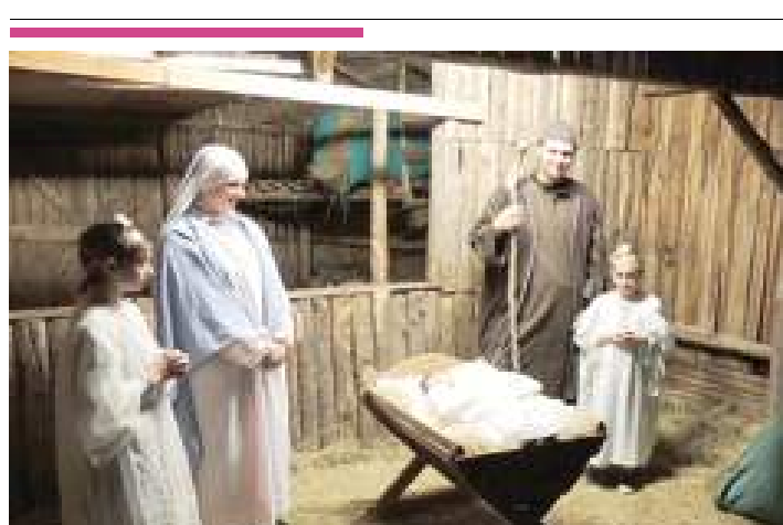
Il Presepe vivente di Casanova, frazione di Varazze

15.30 nel centro storico di Ceriale , dove terrà banco il concerto itinerante degli Zampognari. A Varazze prenderà il via la rassegna "Gospeling Natale in Gospel" che prevede quattro eventi. Il primo si svolgerà oggi pomeriggio (ore 16) in piazza Sant'Ambrogio e vedrà impegnato il Coro Armonie di Cairo e il gruppo Spirituals & Folk di Genova. Domenica al Palasport (ore 21) protagonista sarà il Free Voices Gospel Choir di Torino. —