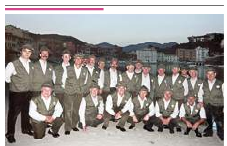
Il coro degli alpini Monte Greppino

nerà all'inizio del '900 per rivivere la Natività di Gesù. A Vado il Presepe vivente "U' Bambin de cent'anni fa", nella frazione di Segno viene rappresentato nelle notti del 22, 23 e 24 dicembre, dalle ore 20 a mezzanotte. Anche quest'anno a Varazze si ripete la tradizione del Presepe vivente a Casanova da domani a lunedì dalle 20 alle 24, con la possibilità di cenare nel percorso enogastronomico. —