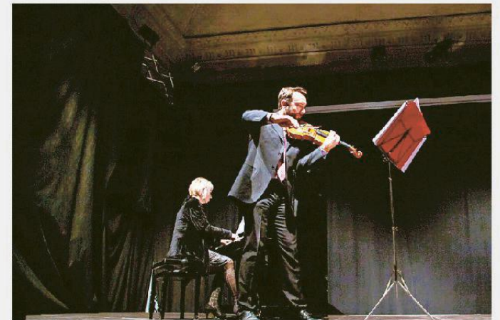
A Finalborgo prosegue la terza edizione dei "Pomeriggi musicali"